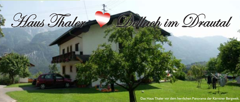
Das Haus Thaler vor dem herrlichen Panorama der Kärntner Bergwelt.